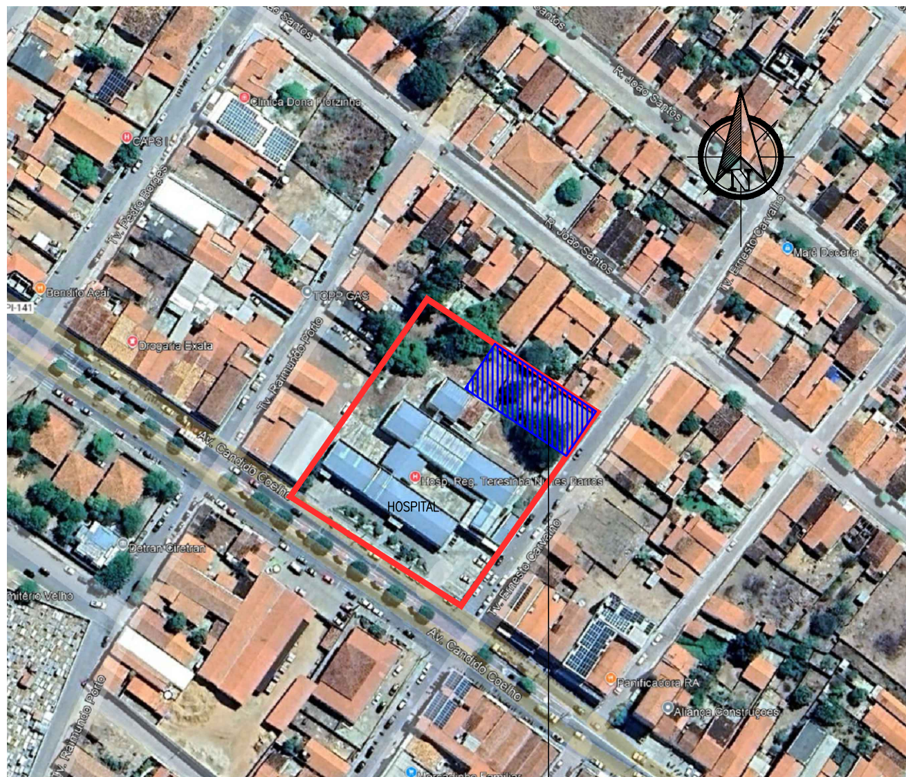
MACROLOCALIZAÇÃO SEM ESCALA Latitude: 8°21'39.27"S Longitude: 42°14'47.57"O

Símbolo indicativo de local de estacionamento de veículos que transporta ou que sejam conduzidos por pessoas portadoras de deficiência físicas - composto de pictograma na cor branca inserido em um quadrado de fundo azul de 1,20m de lado.